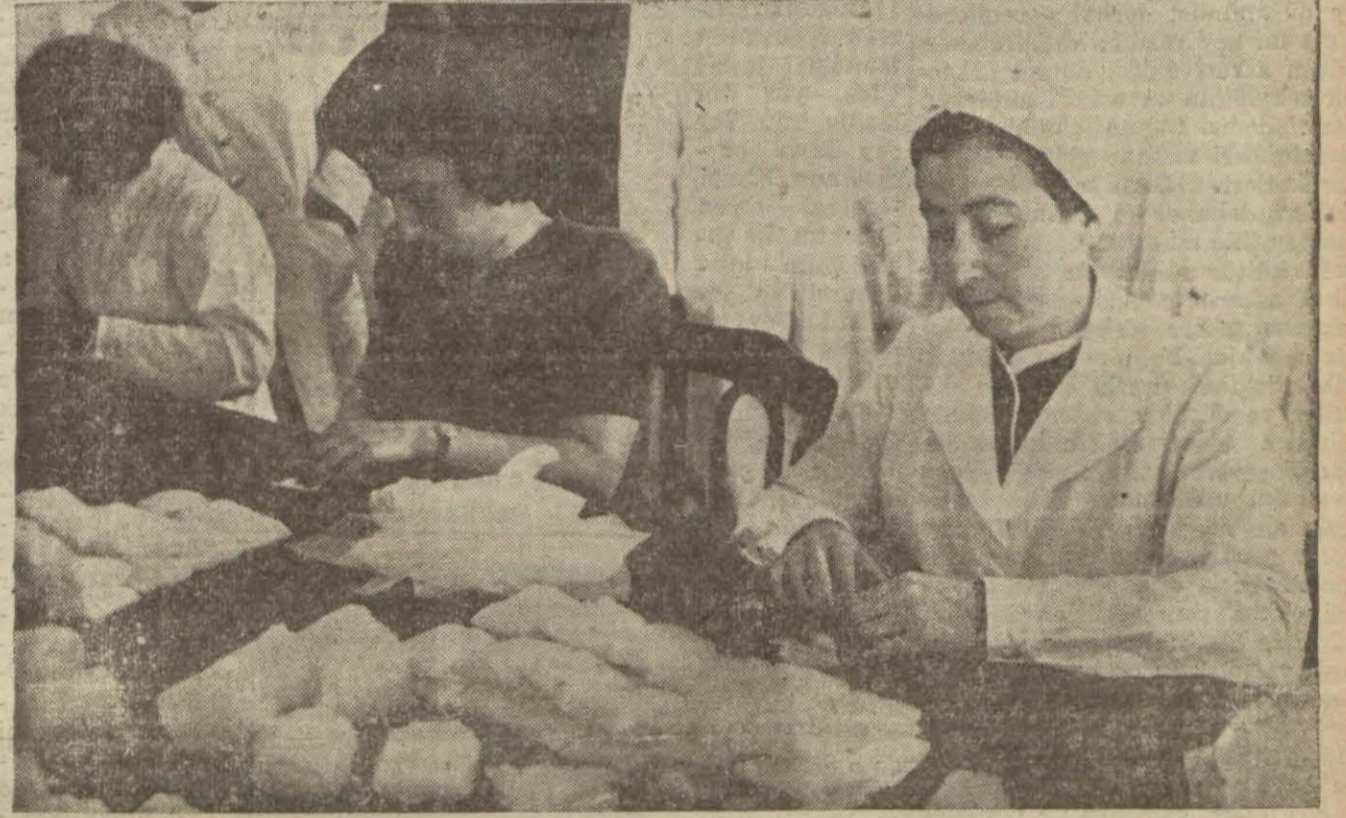
Sayın Bayan İnönü harb sargısı imalâthesinde çalışıyor

Bugün vilâyet Parti merkezinde büyük bir toplantı yapılacak