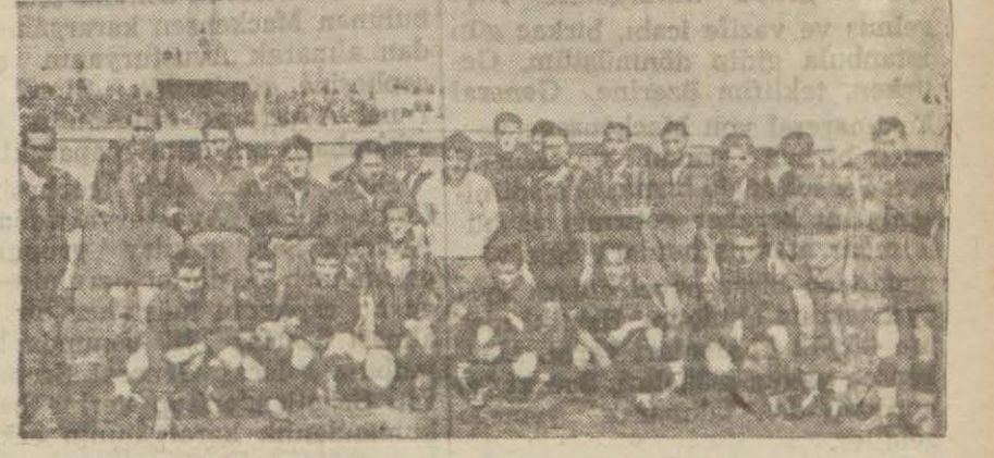
Ankarada karşılaşan Altınordu - Demirsport takımları maçtan evvel

Maskesporlular bilâkis öyle güzel bir iki fırsat buldular ki mutlak surette acemilik yüzünden kaleye gitmekte olan topu kendi a-